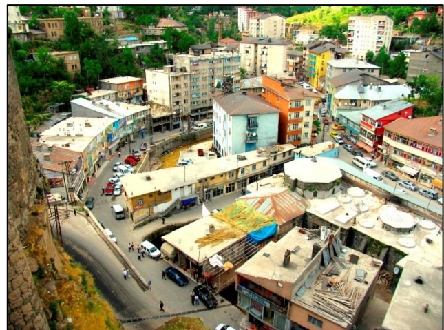
Pogled s citadele na osrednji del mesta Bitlis