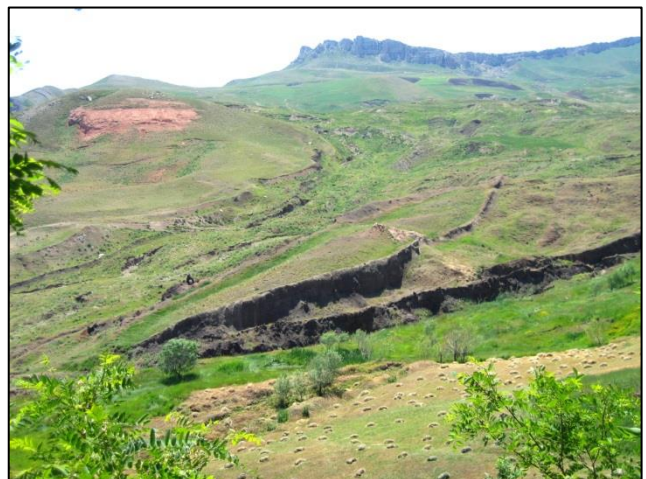
Po ogledu kraterja, povzročenega ob padcu meteorja, smo se z džipi odpeljali po kurdskih vaseh do namišljenih ostankov "Noetove barke"

Sledil je ogled 35 m širokega in 60 m globokega kraterja, ki je na iranski meji, kjer je leta 1892 padel meteor. Ko smo prispeli do njega, je bilo v okolici precej iranskih vojakov, ki pa nas pri ogledu kraterja niso ovirali. Nato smo se z džipi odpeljali po kurdskih vaseh do namišljenih ostankov »Noetove barke«, ki se nahaja na višini okoli 2000 m. Po ogledu zapiskov, načrtov in slik te barke, nameščenih znotraj moderno zgrajene stavbe, smo nadaljevali pot skozi kurdske vasi z lepo obdelanimi polji, toda tu se je čas ustavil – kakor je bilo pred 2000 leti, tako je še sedaj. Videli smo perice volne ob potočku, ki so z udarjanjem s palicami iztiskale iz nje umazanijo, pa tudi voz z velikim polnim lesenim kolesom, v katerega je bila vprežena krava. Vrhunec tistega dne je bil obisk palače Ishaka Pashe iz leta 1789,