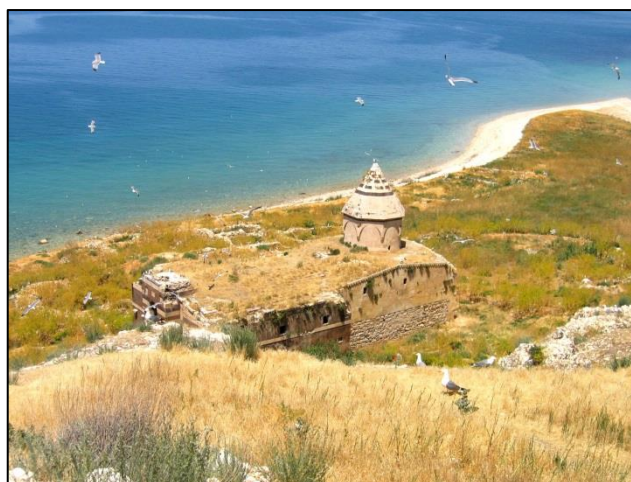
Poleg razvaline armenskega samostana s cerkvijo je otoček Carpanak znan po številnih galebih, ki na njem gnezdijo

Po vrnitvi v mesto Van smo se proti večeru odpravili do domačije, kjer ženske pletejo preproge. Izvedeli smo, da se na tem območju okrog 80 % družin ukvarja z izdelavo preprog. Material zanje pripravijo takole: ovce, ki se poleti pasejo v okoliških gorah, ostržejo, volno operejo v tamkajšnjih potokih, razčešejo, obarvajo z rastlinskimi barvili in poženejo kolovrate. Sledi tkanje domiselno izbranih vzorcev.