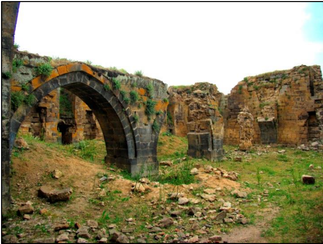
Ostanki karavanskega dvorca Aleman Han, sezidanem v 11. stol. in nahajajočem se ob Svileni cesti

majhnemu mestu Ahlat, ki leži ob jezeru Van. Jezero Van je največje jezero v Turčiji, ki leži 1719 m nad morjem in obsega 3755 km 2 . Je slano jezero ognjeniškega izvora in brez iztoka. Vodo prejema iz številnih majhnih pritokov, izvirajočih v okoliških gorah. Dolgo je 120 km in široko 80 km, njegova največja globina pa je 457 m. Jezero je ostalo brez iztoka v pleistocenu oziroma ledeni dobi, ko je tok lave iz ognjenika Nemrut Dagi zaprl zahodni iztok iz planote Selçuklu proti nižini Mus. Gladina jezera se pogosto močno spreminja; zaradi taljenja snega v okoliškem gorovju se dvigne iz pomladi na poletje za okoli 0,5 m. Znan je primer iz devetdesetih let dvajsetega stoletja, ko se je gladina jezera dvignila za 3 m, kar je povzročilo uničenje mnogih kmetijskih površin. Jezerska voda je močno bazična. Od živih bitij najdemo v njej le na alkalnost prilagojene krape (darek), ki se drstijo v bližini izlivov tekoče vode v jezero.