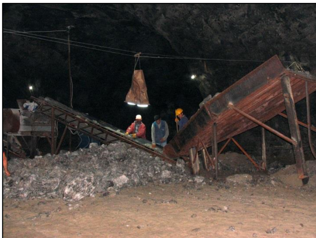
Med sprehodom po rudniku smo si ogledali kopanje, natovarjanje in čiščenje soli v naravnem notranjem jezercu

Obiskali smo še mrtvo mesto iz petega stoletja, kjer stojijo veličastni ostanki 101 porušene cerkve armen-