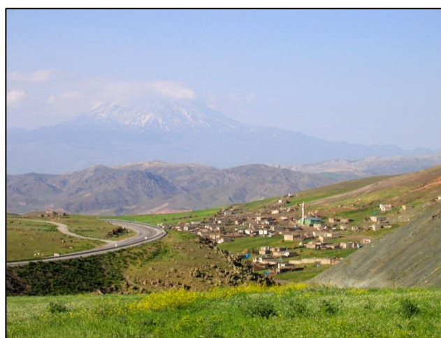
Pred naseljem Yavas smo se za krajši čas ustavili in zrl v zamegljeni Ararat

Pokrajina, po kateri smo se vozili proti gorskemu prelazu Tendürek Geçidi Rakim, visokem 2644 m, je bila