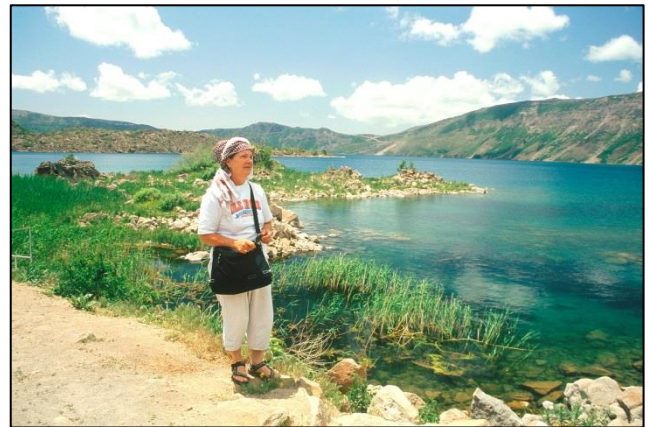
Angelca ob kraterskem jezeru vulkanske gore Nemrut Dagi, visoke 3050 m

Pred vzponom na Nemrut Dagi smo si ogledali mesto Tatvan, ki leži na zahodnem koncu jezera Van. Tu se konča železniška kopna povezava, pot pa se nadaljuje