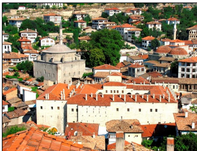
Osrednji del mesta Safranbola je pravi muzej na prostem, zazaščiten s strani Unesca

Ko smo nadaljevali pot, smo naleteli na skalnat podor in čiščenje ceste, a zastoj nam ni skazil razpoloženja. Proti večeru smo prispeli v nekdaj cvetoče mesto Ama-