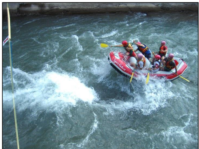
V mestu Yusufeli so šli nekateri iz naše skupine na rafting

Na poti proti Erzurumu smo se za dva dni ustavili v znamenitem turističnem mestu Yusufeli s 6856 prebivalci, kjer smo se namestili v hotelu Barkal, ki stoji tik