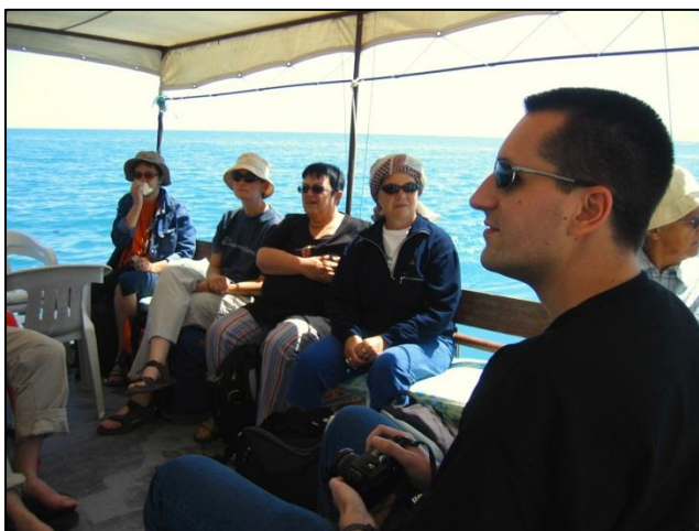
Z barkačo Burak smo po dobrih treh urah plovbe prispeli na otok Carpanak. Ko smo se vračali, smo se ustavili in podvzivali na otoček Akdamar

Ko smo se vračali, smo se ustavili in podvzivali na otoček Akdamar, kjer smo si želeli ogledati armensko stolnico iz enajstega stoletja, ki pa je bila zaradi obnove zaprta. Sicer pa legenda o tem otočku govori o