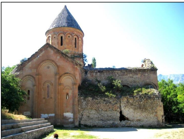
V Ilishamu smo se ustavili ob dobro ohranjeni gruzijski cerkvi, zgrajeni v 11. stol.

Ne glede na prej imnovane naravne in kulturne vrednote se v bližnji prihodnosti obeta potopitev pokrajine z mestecem Yusufeli vred, in sicer zaradi zgraditve hidroelektrarne na reki Čaruh – potopilo naj bi se okoli