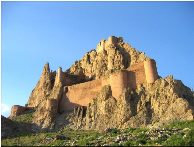
Po prihodu v mesto Dugubeyazit smo se podvzivali po strmem hribu do ostankov urartske trdnjave

na območju vulkana Tendürek močno prekrita z lavo. Izvedeli smo, da se je lava izlivala iz bruhajočega vulkana v sedemnajstem stoletju, hkrati pa izoblikovala okoli 3500 m visok stožec s kaldero, v kateri so tri mala jezera.