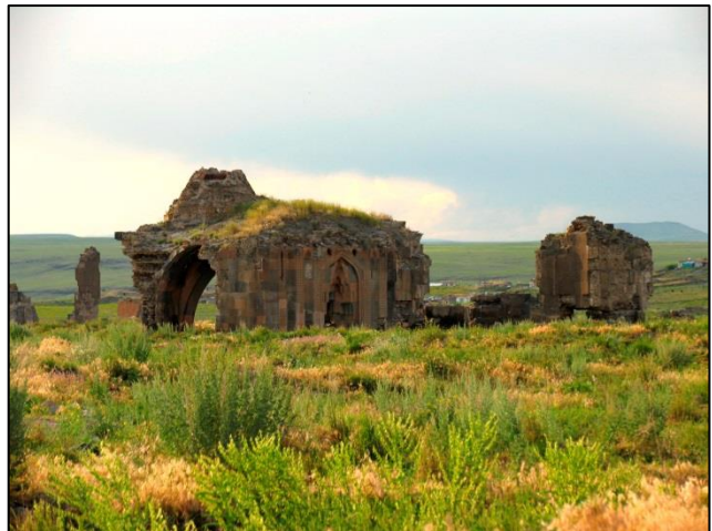
Obiskali smo mrtvo mesto iz 5. stol., kjer stojijo veličastni ostanki 101 porušene cerkve armenske prestolnice Ani

Po jutranjem zadnjem razgledu na trdnjavo nad mestom smo zapustili pust in umazan Kars. Sledil je vzpon