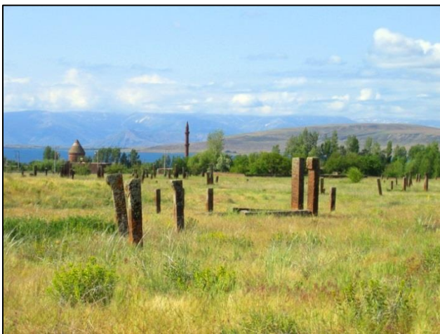
Seldžuško pokopališče, kjer so pokopani znameniti ljudje, predvsem velikaši in vojskovodje

V dokaj hladnem vremenu smo se zvečer sprehodili po glavni ulici mesta Ahlat ter poskusili izvrsten kruh in baklavo. Vstopili smo tudi v tipično turško čajnico, kjer