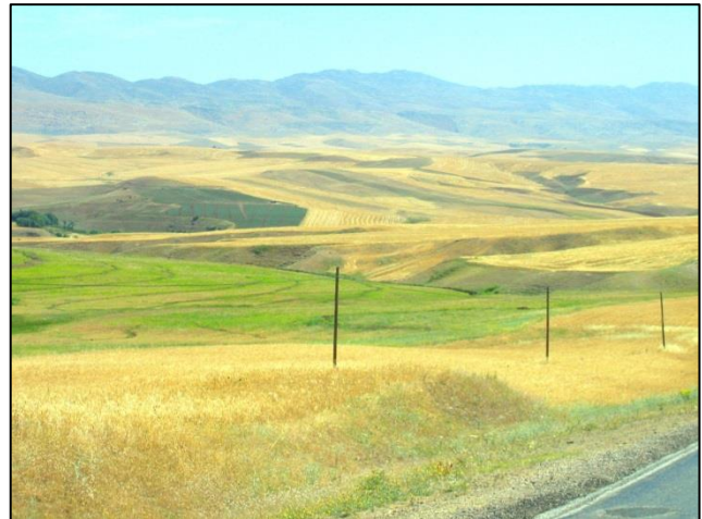
Od sonca obsijana valovita mezopotamska pokrajina z žitnimi polji nas je očarala

dolгим obzidjem, zgrajenim iz črnega bazalta. Slovi po lubenicah in prav lubenica je tudi zaščitni znak mesta. Iz Diyarbakirja smo pot nadaljevali z avtobusom proti naselju Kapru, znanem po znamenitem seldžuškem mostu. Prvi most je bil na tem mestu zgrajen že v času Aleksandra Velikega.