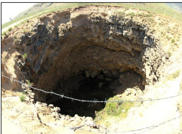
Sledil je ogled globokega kraterja, ki je na iranski meji, kjer je leta 1892 padel meteor

Po vrnitvi v mesto Dugubeyazit, ki leži v objemu slikovitih gora, smo prenočili v hotelu Isfahan. Tisti, ki smo se odpravili na treking po ostrem gorskem, večinom travnatem grebenu, smo vstali ob zgodnji 3. uri. Po dobrih dveh urah smo prispeli na vrh grebena v času, ko je izza Velikega in Malega Ararata vzhajalo son-