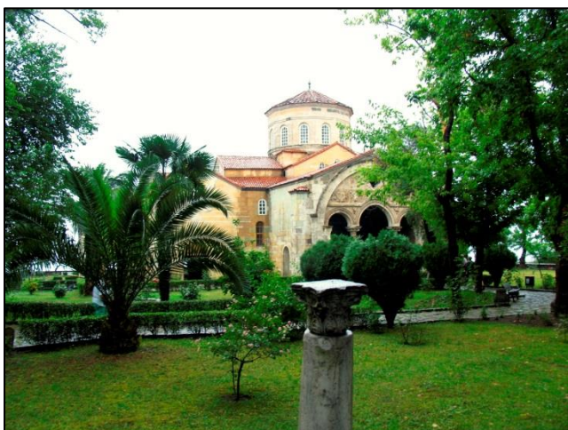
Krščanska cerkev v Trabzonu, ki leži ob Črnem morje, je spremenjena v muzej

Ko smo zapustili Trabzon, smo se začeli vzpenjati proti okoli 2200 m visokemu prelazu Eğribel Geçidi. Pred njim smo se še ustavili v turški vasi, v kateri naj ne bi bilo nič posebnega, a za nas je bila več kot posebna. Med pitjem čaja je naši sopotnici Alenki, ne da bi