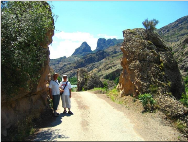
Drugi smo se odpravili na zanimiv treking po skalnati dolini reke Barkol

nad sotočjem izjemno deroče reke Čaruh in rečice Barkol.