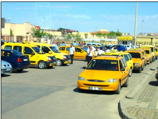
Pred letališčem v Diyarbakirju je veliko taksistov, a ob našem prihodu malo potnikov

Med potjo do okoli 15 km oddaljenega jezera Van, smo se ustavili pri močno utrjenem karavanskem dvorcu Aleman Han, sezidanem v enajstem stoletju in nahajajočem se ob Svileni cesti. Pot smo nadaljevali proti